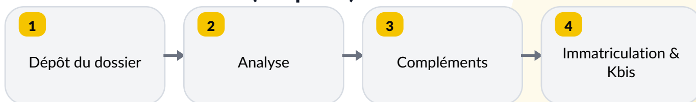
Schéma de traitement (simplifié)

Certaines pièces peuvent être demandées selon votre activité (réglementation, diplôme, autorisation...). Si vous avez un doute, mieux vaut sécuriser avant l'envoi.